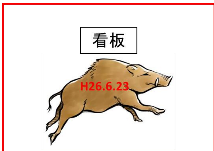
図 2. 捕獲個体+看板